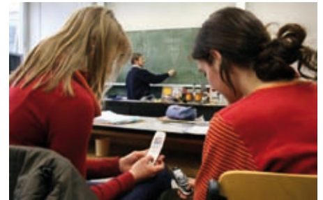
SMS während der Stunde

nen Besuchen am Plattensee, wohin sie jährlich zum Urlaub mit meinem Onkel anreiste, für amüsante Stunden, wenn sie erzählte, dass man in der DDR in der Arbeitszeit zu Friseur und Einkauf ging. „Unglaublich“, meinten wir damals, über „soviel schlechte Arbeitsmoral“. Heute, wo wir von einem unbarmherzigen Arbeitsprozess „zu Tode gehetzt werden“, bis 67 arbeiten sollten (was nur einem Witzblatt entnommen sein kann, da Vierzigjährige heute schon zum Teil keine Arbeit mehr finden), und jeder Dritte „burnout-gefährdet“ ist, könnten wir uns glücklich schätzen, während der Arbeit zum Friseur gehen zu können. „Ist nicht“, da drohte die Kündigung und statt zum „Barbier“ zu gehen, lassen wir uns „über den Löffel barbieren“.