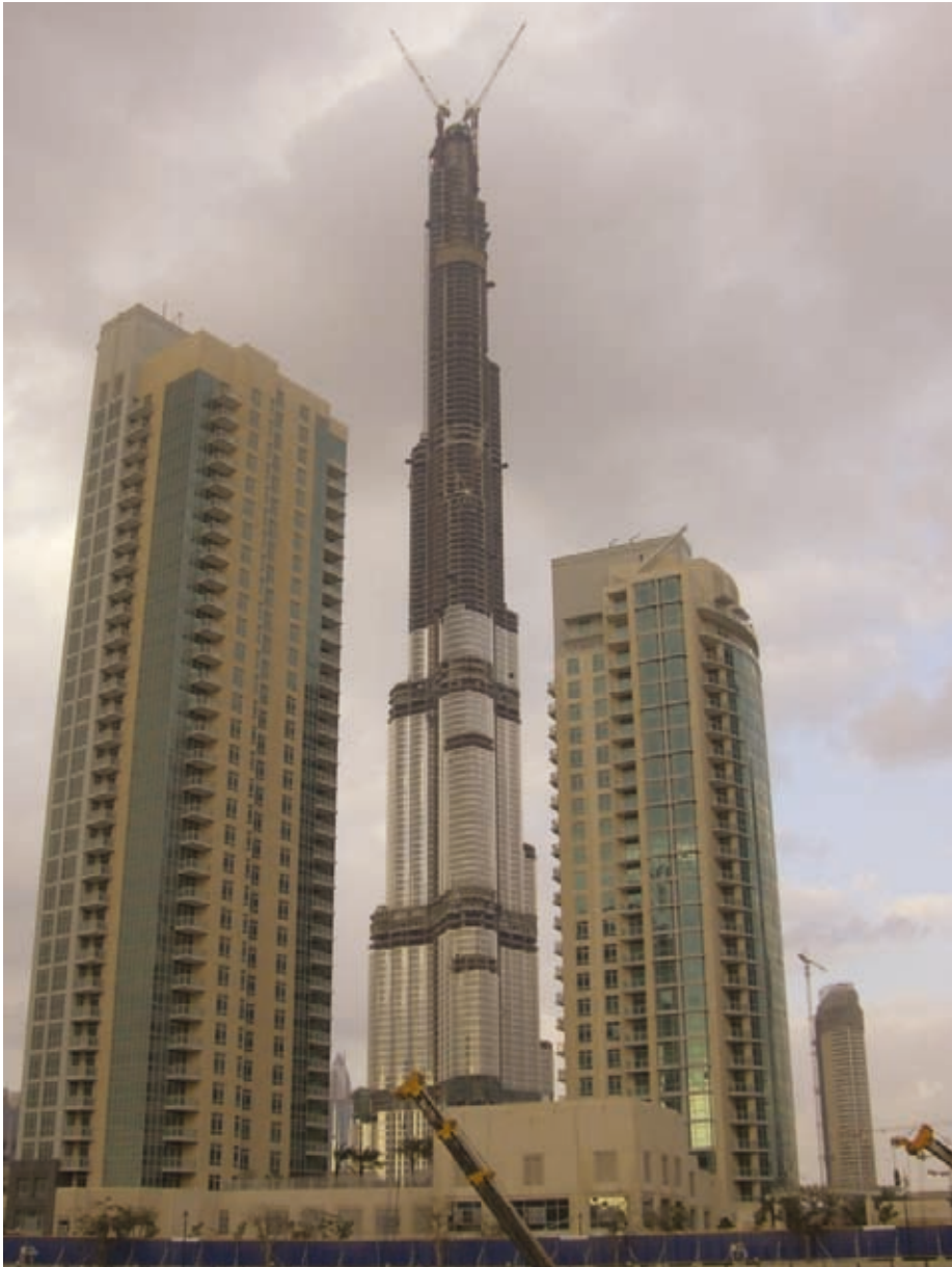
„Dubaj-Wahnsinn“ fast 1km hoch

Ein gefährlicher Leichtsin, der in der Öffentlichkeit unbeachtet bleibt, ist auch die Wohnsituation vieler, die sich scheinbar nicht bewusst sind, dass schönes und modernes Wohnen oft wenig mit „gesundem Wohnen“ zu tun hat. So, als gäbe es weder Abgase noch Lärm, baut man einen Wohnblock nach dem anderen in verkehrsreichsten Straßen „direkt an den Verkehr heran“. Die meisten Mieter oder Käufer „erwachen“