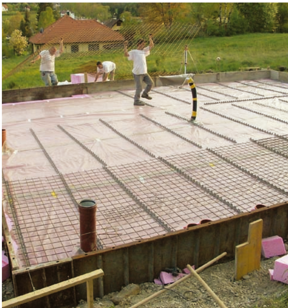
„Ober meiner, unter meiner, links, rechts, gütts nix...“ Aric Brauer

Unseren „Käfig“, der aus Baustahlgittern besteht, die heute in jeder Mauer, jedem Boden, jeder Decke (Ausnahme Holzbauten) enthalten sind, feiern Architekten und Bauherrn weltweit als