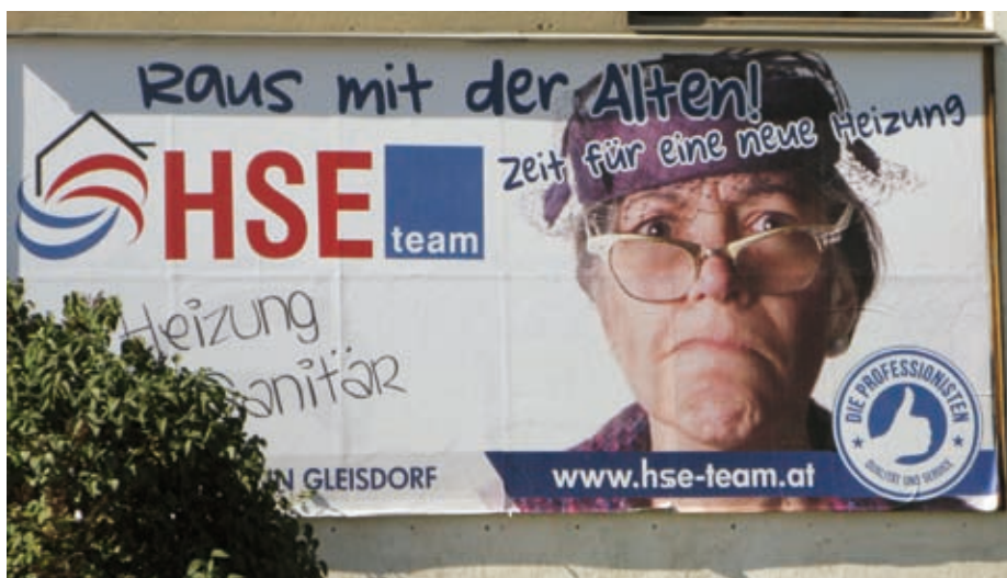
Eine „nette“ Werbestrategie des Unternehmens, Frauenfeindlichkeit ist alles!

Lebenserfahrungen an ihre Kinder und Enkel weitergaben, konnten die Jungen Versuchungen begegnen und Gefahren erkennen. Heute haben die Einflüsterer leichtes Spiel, die steigenden Alkoholprobleme der Jugend und die zunehmende Drogensucht sprechen für sich. Die Industrie rührt die Werbetrommel für FastFood und Techno-Schnickschnack, eine rapid dem Gesundheitsdesaster zustrebende Jugend ist das Ergebnis. So gut wie keine Zeit verbringen Jugendliche heute in der Natur, dagegen Stunden bei Computer, Fernsehen und beim Spiel mit dem SMS-Finger. Eltern, die sich dagegen aussprechen, werden als böse oder „alte Trottel“ eingeschätzt. Wollen wir es wirklich so weit kommen lassen wie in Deutschland, wo ein Mädchen ihre Mutter erschlug, weil ihr diese den Zugang zum Internet verwehrte?