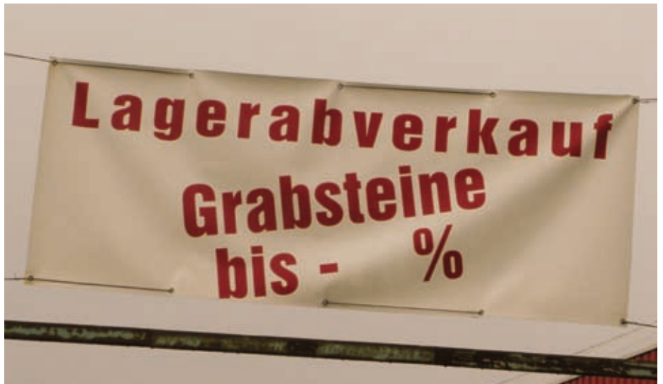
Werbung eines Steinmetzunternehmens

Ich habe mir gleich 5 Stück besorgt, wenn's doch so billig ist!