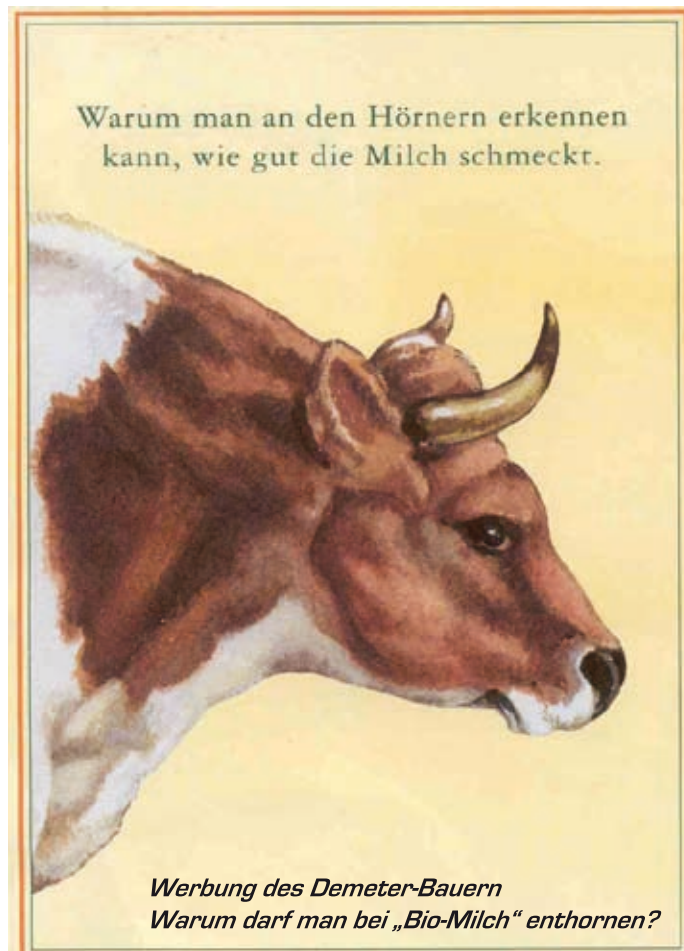
Werbung des Demeter-Bauern Warum darf man bei „Bio-Milch“ enthornen?

Die Milch – eines der gesündesten Nahrungsmittel – hat man so lange naturwidrig „misshandelt“, bis sie ein großer Teil der Menschen nicht mehr verträgt. Jetzt kommt man mit den „Schauergeschichten“, dass Milch für den menschlichen Organismus unverträglich sei, augenscheinlich vergessend, dass die Milch neben Getreide, Kräutern und Fleisch seit Jahrtausenden ein wohlbekömmliches Grundnahrungsmittel darstellte, ohne die die Entwicklung der