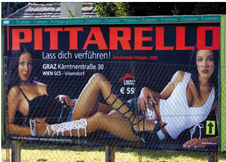
Die Modebranche moralisch „verkommen“

Die Frau als „Ware“, überall in Österreich auf Plakatwänden und Schmutdelinseraten zu sehen, wird – durch TV und Medien angeheizt – zum „Lustfleisch“ degradiert. Die Frauen, „weggeschaltet“ von allen Schalthebeln der Macht und darob nicht in der Lage, ihre Rechte selbst in die Hand zu nehmen und durchzusetzen, werden also weiter auf das warten, was ihren männlichen Pendants immer locker von den Lippen kommt, auf die „Emanzipation“.